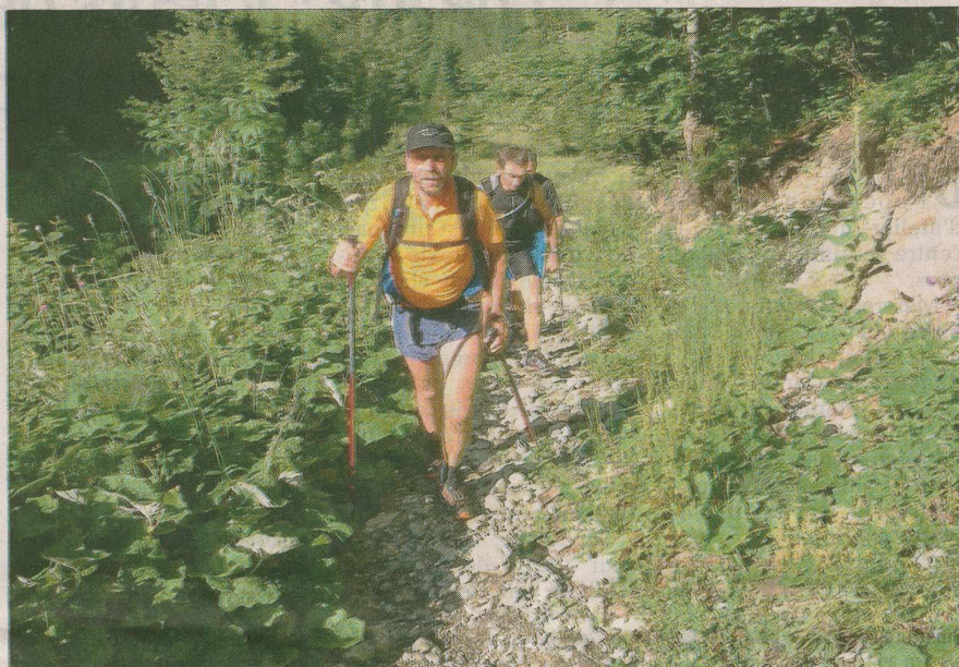
Les trailers devraient bénéficier de bonnes conditions météorologiques ce samedi et pouvoir apprécier pleinement les magnifiques paysages.